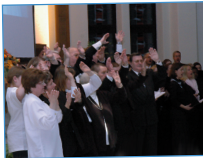
Gebärdenschor anlässlich eines Konzertes in der Kirche Herford-Mitte (Nordrhein-Westfalen) im März 2005.

In Nordrhein-Westfalen begann Apostel Gunter Homburg 1998 damit, die Gottesdienste für Hörgeschädigte vorwiegend in den Heimatgemeinden der Betroffenen