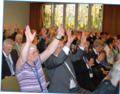
Applaus und Vorfreude auf das Wiedersehen beim sechzehnten Hörgeschädigten-Treffen im Jahr 2015.

Das 10. HGT fand in Cuxhaven statt. Bezirksapostel Karlheinz Schumacher begleitete die Hörgeschädigten durch die Tage.