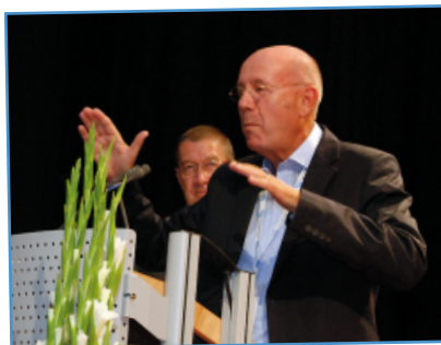
Bischof i.R. Rainer Knigge im August 2009 in Hürth: "i.R. steht für "in Reichweite", so seine Botschaft an die Hörgeschädigten.