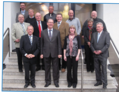
Die Verantwortlichen für die Hörgeschädigten-Seelsorge in den deutschen Gebietskirchen und der Schweiz in Kassel 2012.

Das meinten die Verantwortlichen durchaus im wörtlichen Sinn. Hier stand die Frage zur Diskussion, ob nicht neben der von Günther Lierse bevorzugten Lautsprache begleitenden Gebärdensprache (LBG) auch die Deutsche Gebärdensprache (DGS) Raum haben könnte. Dabei handelt es sich um zwei völlig unterschiedliche Sprachkonzepte.