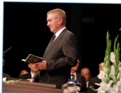
Bezirksapostel Armin Brinkmann zum 11. Hörgeschädigten-Treffen im August 2009 in Hürth bei Köln.

Eine große Anzahl mittlerweile geschulter Gebärdendolmetscher stehen zur Verfügung. Sie reisen dann, wenn keine speziellen Gottesdienste für Hörgeschädigte stattfinden, in die Gemeinden, um vor Ort zu gebärden.