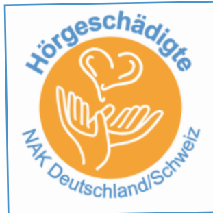
Das neue Logo, das es mit unterschiedlichen Schrifträndern für alle Gebietskirchen gibt.