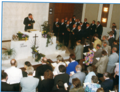
Erstes Treffen der Hörgeschädigten aus den deutschen Gebietskirchen 1999 in Quelle mit Bischof Horst Simon.