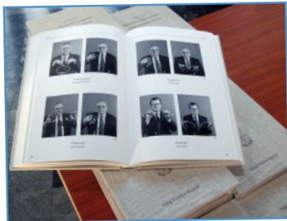
Das "Glaubensbezogene Gebärdenlexikon", ein Standardwerk für den Gebrauch in Gottesdiensten.