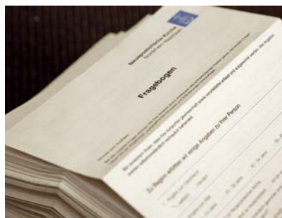
Mehr als 500 Rückmeldungen auf die Fragebogenaktion

Im November 2012 hat die Gebietskirche Nordrhein-Westfalen eine schriftliche Befragung aller Gemeindemitglieder durchgeführt, die die kirchlichen Angebote derzeit oder seit längerem nicht wahrnehmen. Inzwischen liegen die Ergebnisse vor und wurden bereits am Kirchentag in einem Workshop vorgestellt. Die Bewertungen fließen nun in die Arbeit der verschiedenen Projektgruppen ein, die daraus Maßnahmen entwickeln. Ziel der Befragung war es, Erkenntnisse über die persönliche Einstellung der Mitglieder zur Neuapostolischen Kirche sowie Ansatzpunkte für innerkirchlichen Änderungsbedarf zu gewinnen. In dem vierseitigen Fragebogen wurden zudem Gründe abgefragt, warum die neuapostolischen Christen die Angebote der Kirche derzeit nicht oder nicht mehr regelmäßig nutzen.