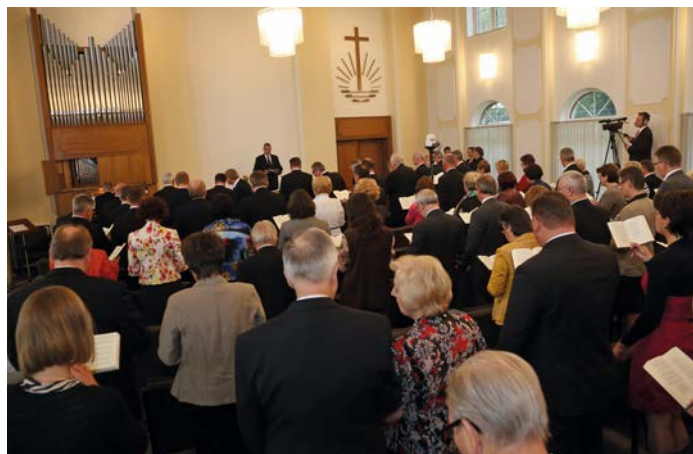
100 Teilnehmer erlebten den Gottesdienst im Feierraum der Kirchenverwaltung

Die Kraft des Glaubens war Thema eines Gottesdienstes, den Bezirksapostel Armin Brinkmann am 8. September 2013 für die Amtsträger und Lehrkräfte sowie ihre Partner feierte. Er wurde aus dem Feierraum der Kirchenverwaltung via Internet in 59 Gemeinden in NRW übertragen. Dazu waren im Vorfeld insgesamt 59 Gotteshäuser in Nordrhein-Westfalen mit DSL-Anschlüssen oder UMTS-Verbindungen sowie einem „IP-TV“-Empfänger ausgerüstet worden. Zwar erreicht die Übertragung über das Internet nicht die Qualität der bisher gängigen Ausstrahlungen über Satellit, allerdings ist die IPTV-Übertragung qualitativ ausreichend, kostengünstiger und künftig ausbaufähig. Grundlage für die Predigt war das Bibelwort aus Johannes 6,28.29: „Da fragten sie ihn: Was sollen wir tun, dass wir Gottes Werke wirken? Jesus antwortete und sprach zu ihnen: Das ist Gottes Werk, dass ihr an den glaubt, den er gesandt hat.“ „Die Kraft des Glaubens soll zur Ausreife der Seele führen“, lautete die Kernbotschaft von Bezirksapostel Armin Brinkmann im Gottesdienst.