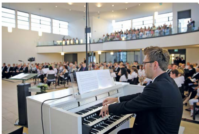
Einmal im Jahr lädt Bezirksapostel Brinkmann zum Zentralgottesdienst ein

Die neuapostolischen Christen aus Nordrhein-Westfalen blickten am Sonntag, 14. Juli 2013, nach Bad Oeynhausen (Bezirk Herford). In der im Jahr 2012 neu eingeweihten großen Kirche fand der diesjährige Zentralgottesdienst statt. In der Predigt vermittelte Bezirksapostel Armin Brinkmann den Gläubigen die Gewissheit, dass Gott ein lebendiger und verlässlicher Gott ist. „Gott steht zu seinem erwählten Volk“ sei auch die Überschrift des Abschnitts im 41. Kapitel des Jesajabuches, aus dem er das Bibelwort für diesen Gottesdienst ausgewählt habe, so der Bezirksapostel.