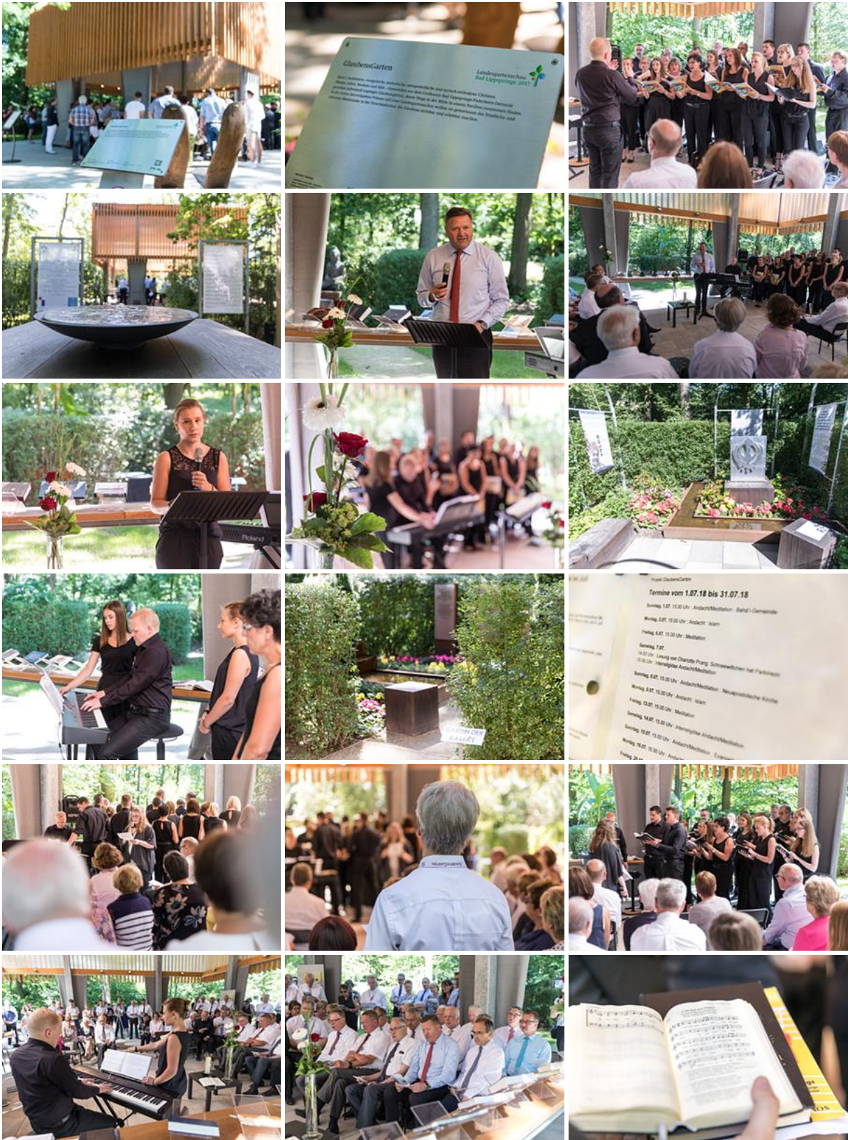
Einstimmung im Glaubensgarten