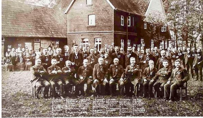
Zur Erinnerung an die Apostel-Versammlung in Bielefeld am 23. Oktober 1905