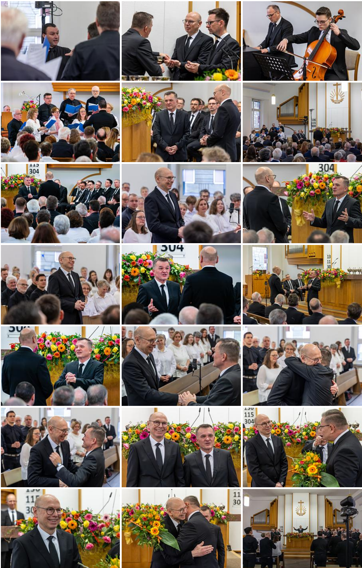
Bezirksapostel in Duisburg: Bischof Manfred Bruns in den Ruhestand verabschiedet